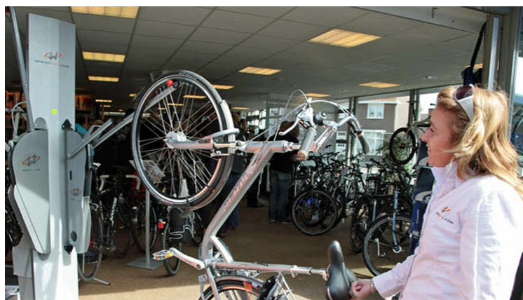
Rangez votre vélo d'une seule main.

Dès que le vélo est dans le passage de roue, il est en sécurité dans le porte-vélos. Ou plutôt, il est suspendu au support, ce qui prend moins de place. Le retirer de l'étagère est tout aussi facile. Une fois de plus, vous attrapez le vélo par le guidon et la selle. En éloignant le vélo du mur, le bras se met en mouvement et guide le vélo vers le sol. Après le clic, le vélo est déposé et vous pouvez l'emporter avec vous.